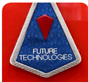
High Frequency Emblem